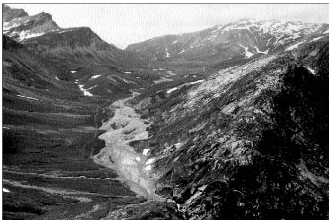
La cuntrada dalla Greina: Dretg dalla foto il Muot la Greina, 2398 m s. m. La spunda dretga da quel, il Carpet la Greina, vegn ad esser culissa dall'exposiziun.