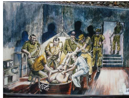
Folter / tortura Amnesty International Chur / Cuera December 2006 - fevrer 2007

Exposiziun d'informaziun e benefeci da e per Amnesty International . Cun documentaziuns e maletgs - biars dessignai dallas unfrendas sezas..