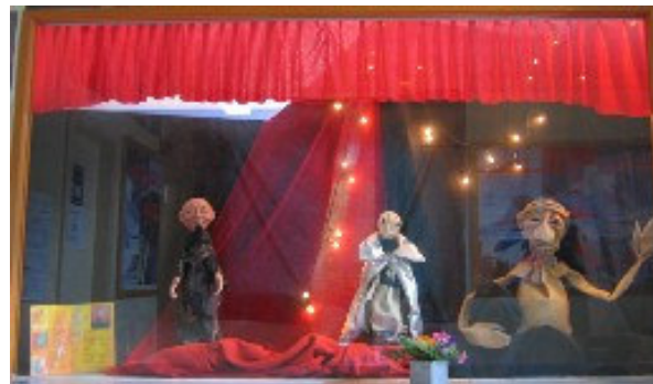
Bild: Théâtre Johana: Marionetten. Ausstellung, Aufführungen, Kurse (2005+06).

Il spurtegl d'art, Vossa pintga gallaria alla staziun Sumvitg-Cumpadials en Surselva giaviascha a Vus è vinavon interessanta cultura, ed engrazia per tut il sustegn.